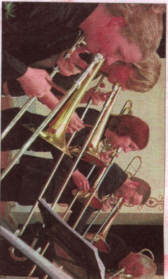
Die Posanisten aus Lemgo, die sich dem Thema Eisenbahn aus verschiedenen Zeitepochen widmen.