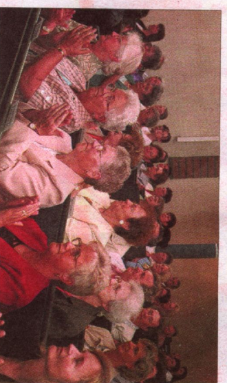
Die begehrtesten Zuhörer in der St.-Vitus-Kirche, die u.a. auch aus Rathmannsdorf kamen.

Die St.-Vitus-Kirche - fast voll besetzt - macht sich auch als Konzertsaal bestens: dezent nur ausgestattet, keine Säulen, klare Akustik, Orgel ohnehin. Vorn also unser Gast-Posamenchor. Drei Gymnasialstudenten, ein kunstbegeisterter Mediziner, ein Profi und Chef zugleich - allesamt perfekt auf ihren Instrumenten. Spielen scheinbar mühelos, freuen sich dabei. Das steckt an, das springt über. Freilich - viele der Titel sind von sich aus eher anspruchsvoll, sind brave Volksweisen. Das verlockt andererseits „was draus zu machen“. Darum durchweg vielstimmige Bearbeitungen, die dann ab und zu auch mal irrgewidme zerpfückt wirken. (Auf sattes Unisono-Blech müssen Wagner- und Bruckner's ners leider verzichten.)